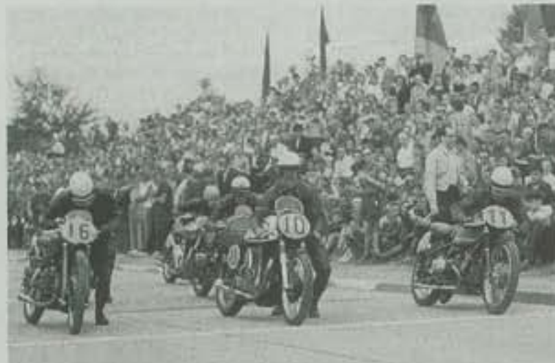
Start der Klasse bis 500 Kubikzentimeter im Jahr 1953.